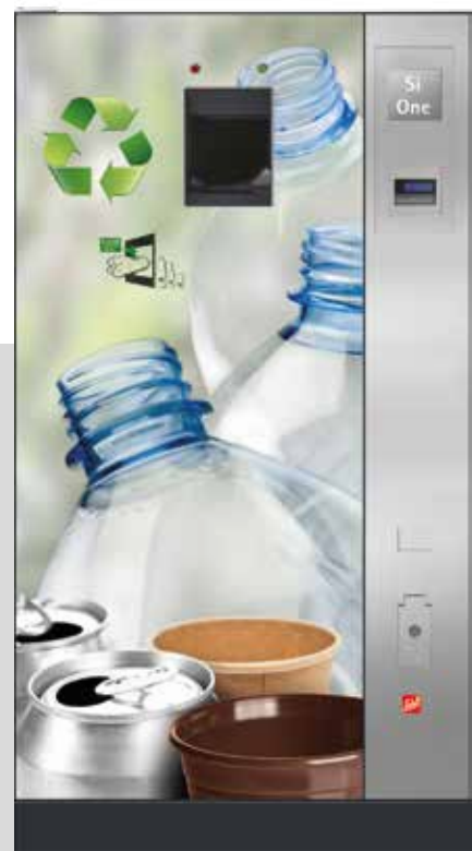
Die SiOne-Serie von Sielaff bestehend aus SiOne Small und SiOne.