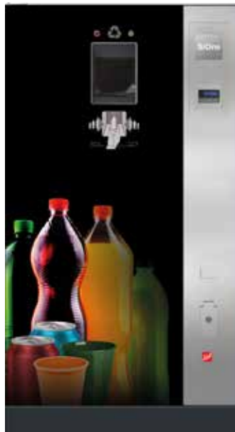
SiOne (Beispiel Design A „Color Explosion“ – Flaschen/ Dosen/Becher bunt)