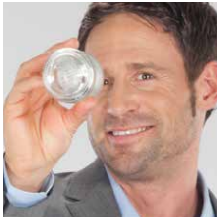
Einfache und sichere Annahme durch Einlegen des Leergutes