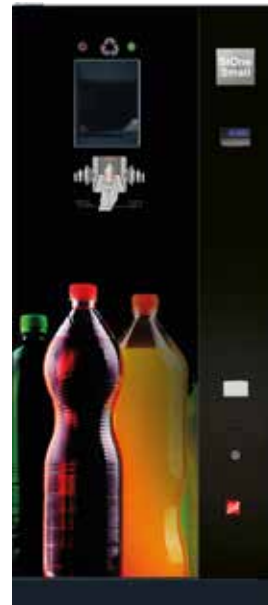
SiOne Small (Beispiel Design C „Color Explosion“ – Flaschen bunt)