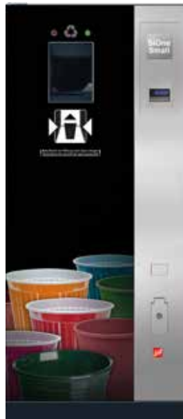
SiOne Small (Beispiel Design B „Color Explosion“ – Becher bunt)