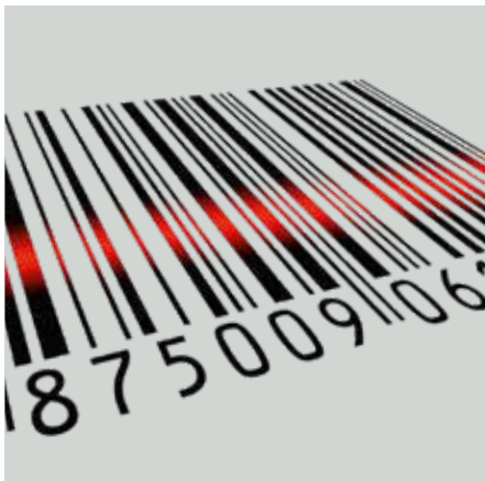
Vielfältige Möglichkeiten der Produktannahme über den Strichcode

Dank unserem konzeptionell durchdachten, wartungsarmen Betrieb ist Profitabilität an allen Aufstellplätzen garantiert.